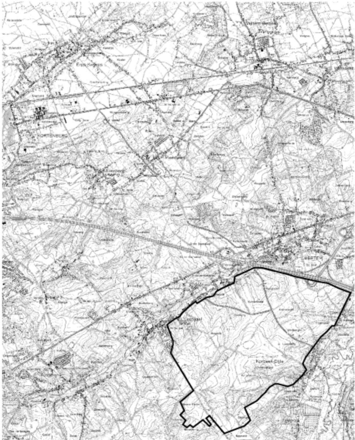
kaartblad 32-1 schaal 1/50000 hamsterbescherming