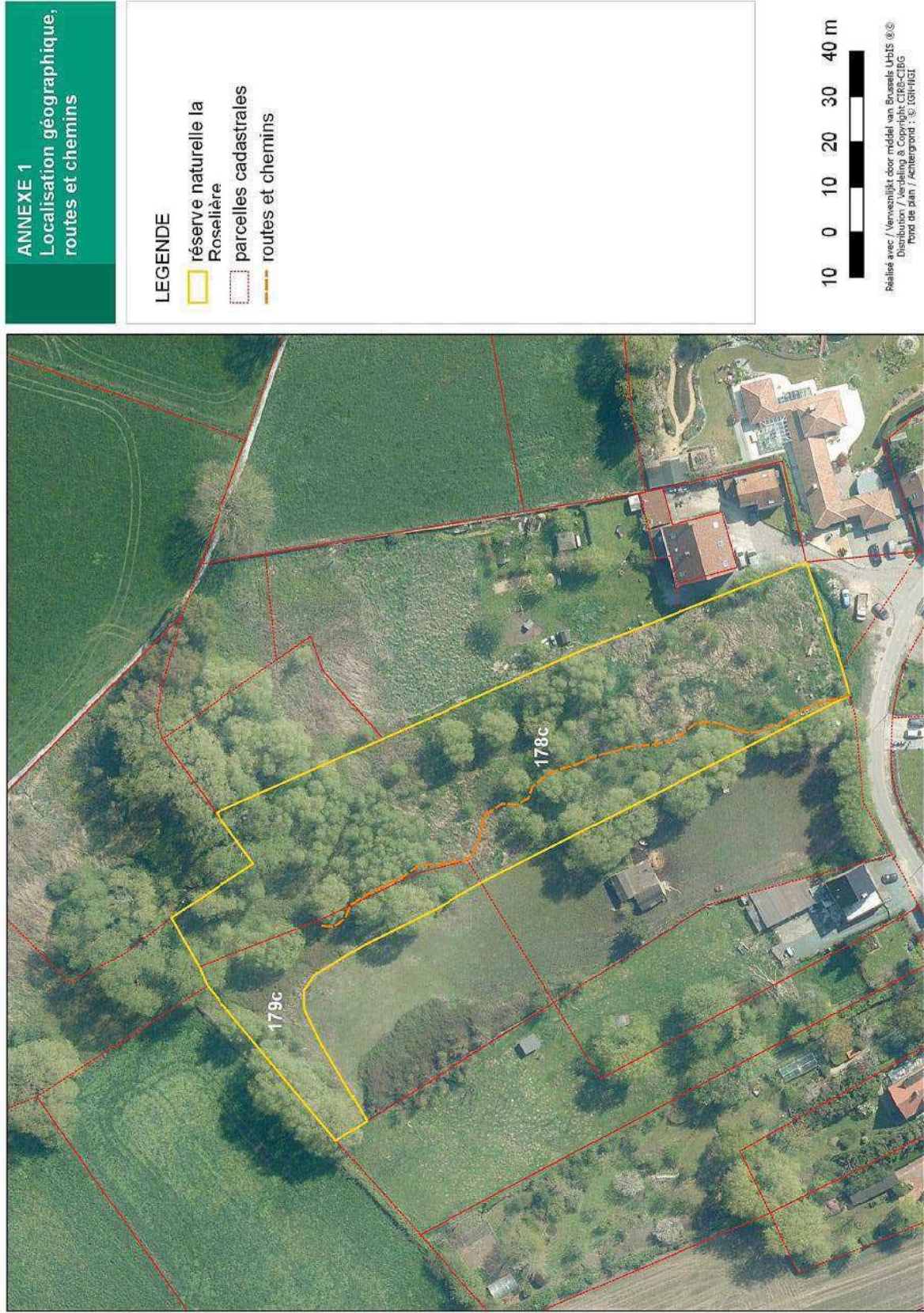
Annexe 1 : Localisation géographique, routes et chemins

Vu pour être annexé à l'arrêté du Gouvernement de la Région de Bruxelles-Capitale du 17/01/2019 désignant une partie de la Roselière de Neerpede située à Anderlecht comme réserve naturelle agréée