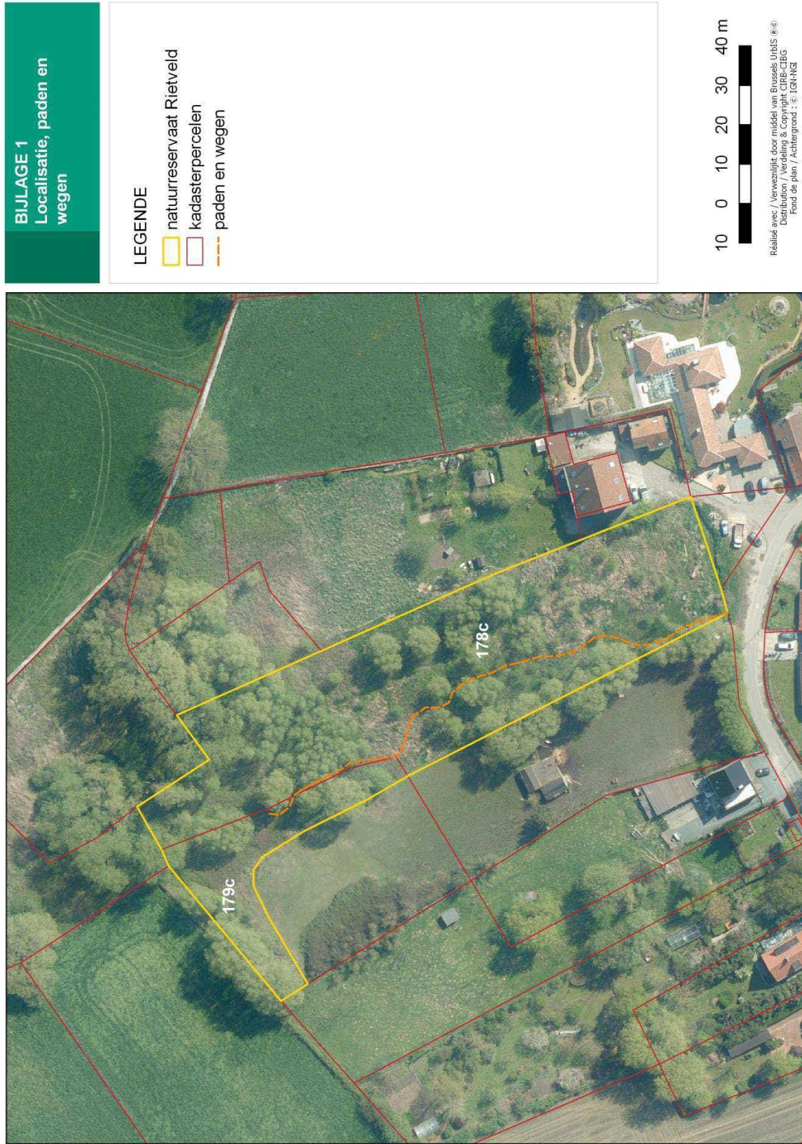
Bijlage 1 : Localisatie, paden en wegen

Gezien om als bijlage te worden gevoegd bij het besluit van de Brusselse Hoofdstedelijke Regering van 17/01/2019 tot aanwijzing als erkend natuurreservaat van een gedeelte van het Rietveld te Neerpede, Anderlecht